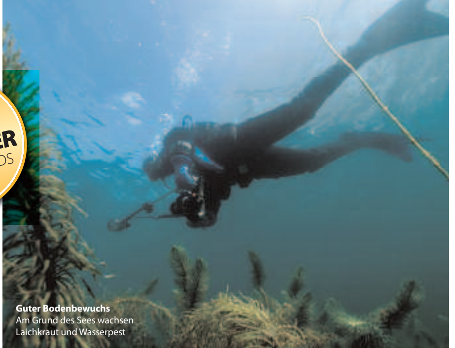
Guter Bodenbewuchs Am Grund des Sees wachsen Laichkraut und Wasserpest